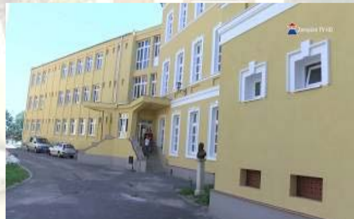
Iskolánk főbejárata a névadó mellszobrán