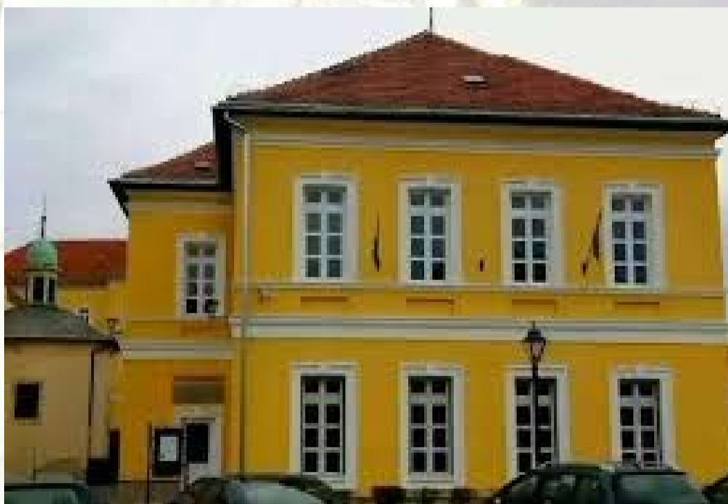
A 2018-ban kívül-belül gyönyörűen felújított iskolánk homlokzati képe

Jó tanulást, és főleg kellemes és tartalmas időtöltést, jó szórakozást kívánunk nektek!