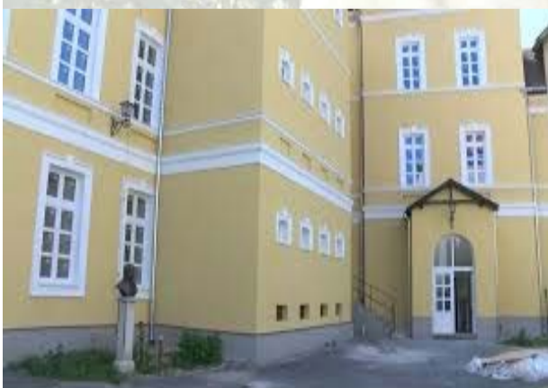
Megújult iskolánk ún. „Gyöngyösi-kapu” felőli bejárata